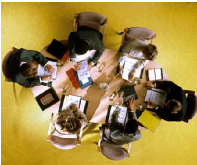
U postupku mirenja svi sudionici sjede za ovalnim stolom...